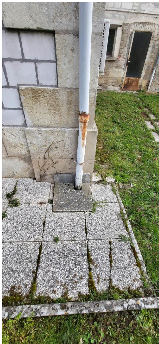
Pied de descente EP