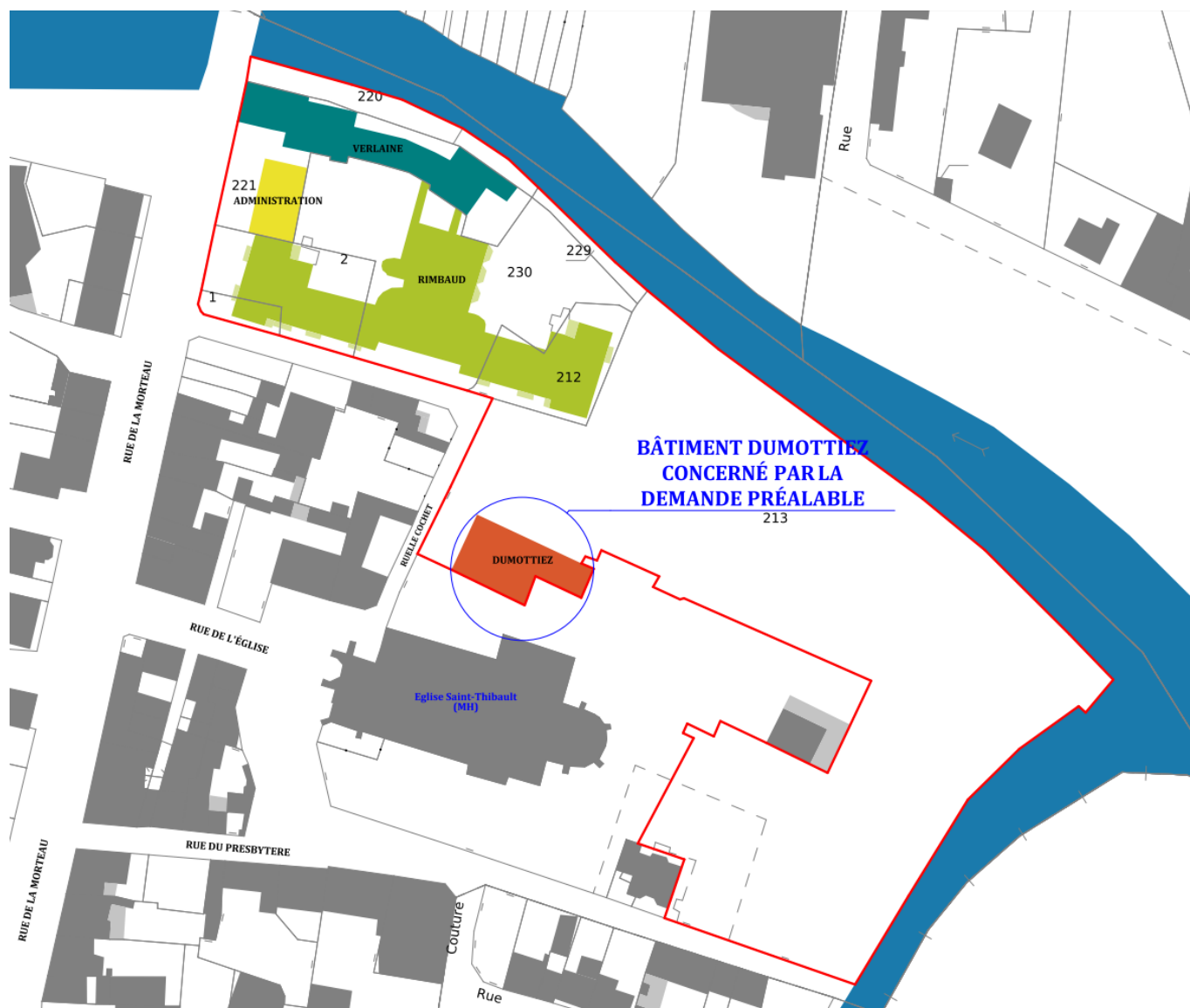
DP1 Plan de situation