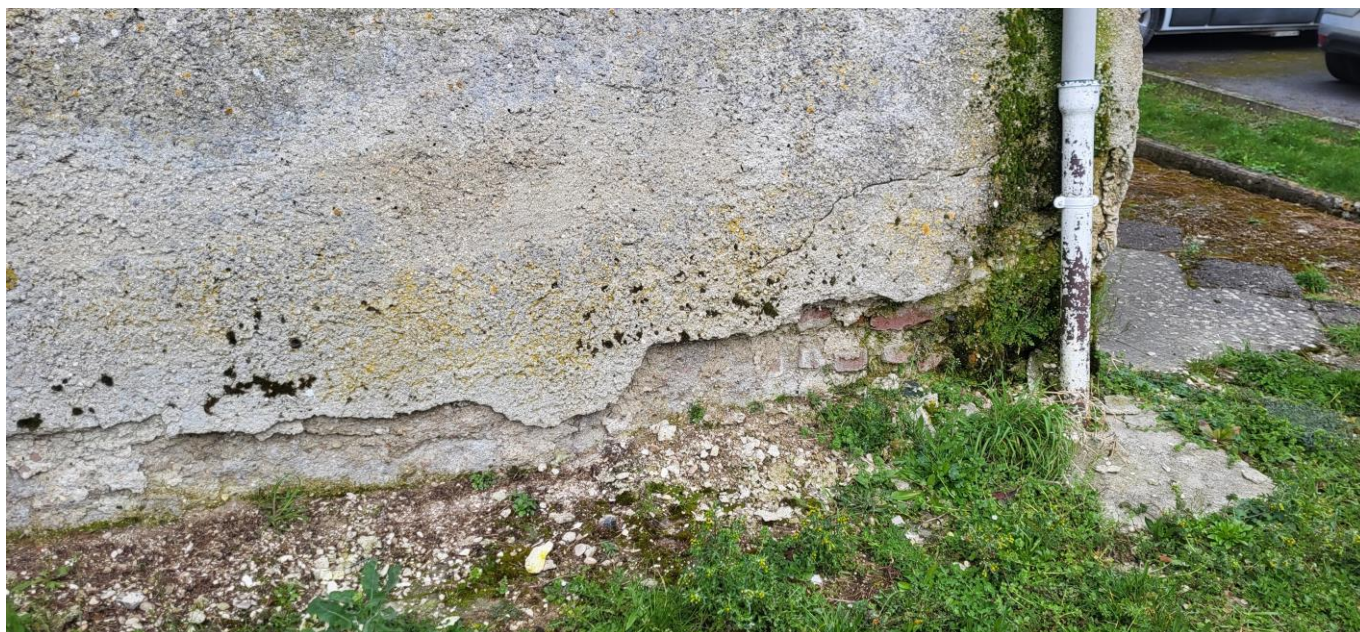
Dégradation du pied de bâtiment (Est)