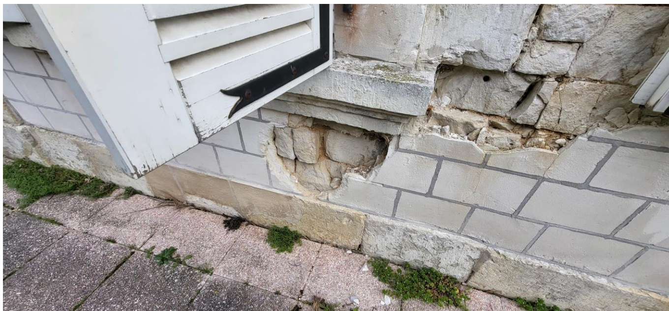
Défaut d'appareillage en allège de l'UVP