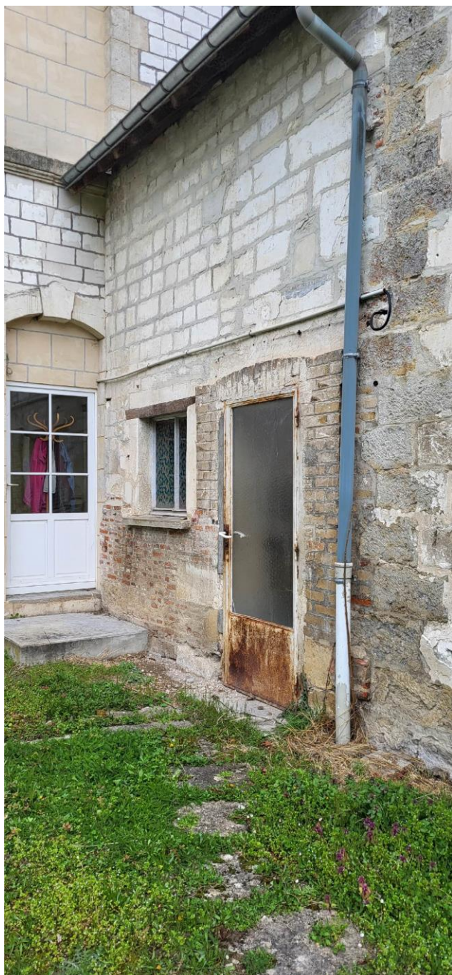
Angle UVP / Annexe (Sud)