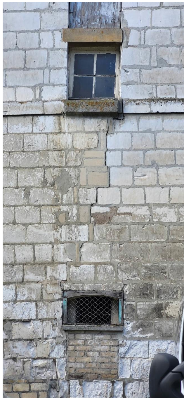
Fissure en façade Est de l'annexe