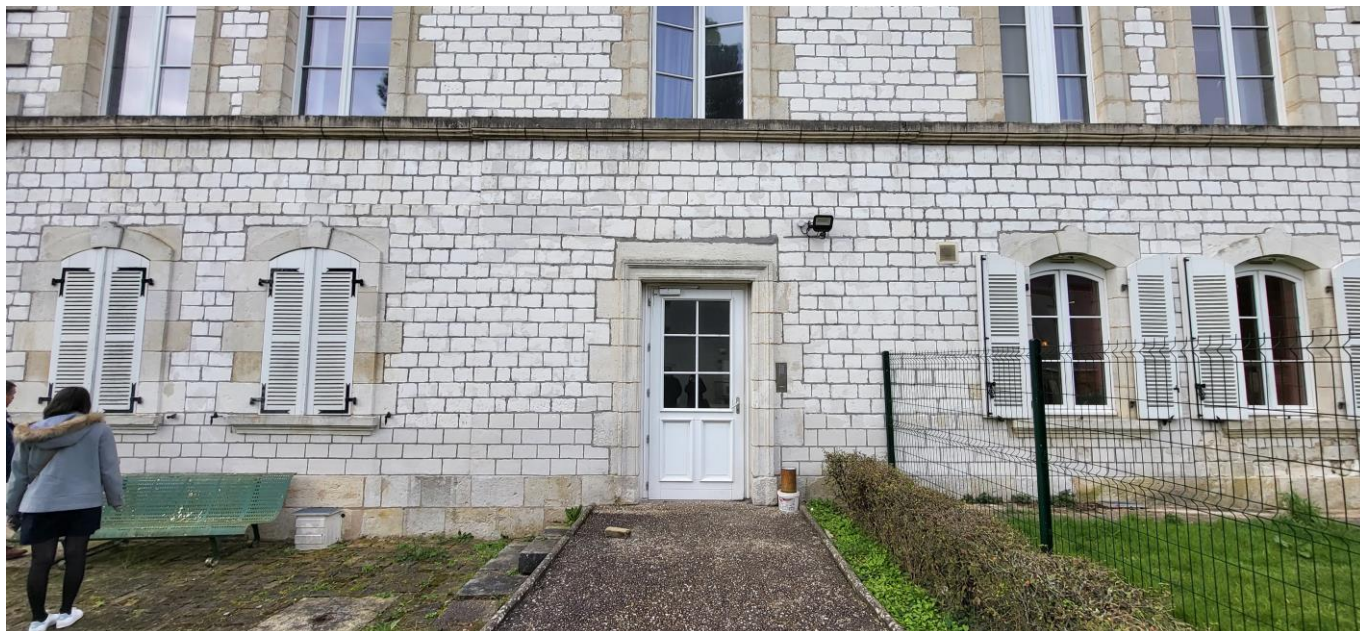
Vue de l'entrée principale